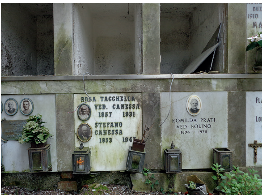
Deels geruimde Italiaanse graven waarbij te zien is dat elk lampje op de elektriciteit is aangesloten

Is dat geen mooi idee én een extra inkomstenpost voor Nederlandse begraafplaatsen? Leg elektriciteit aan, geef mensen de mogelijkheid van een lichtje op het graf en vraag daar een leuk bedrag voor. Misschien wat lastig bij de ‘gewone’ zandgraven, hoewel je dan met staande lantaarntjes zou kunnen werken, maar toch zeker een goed idee voor de wandgraven. Zorg voor meer licht op de Nederlandse begraafplaatsen. ■